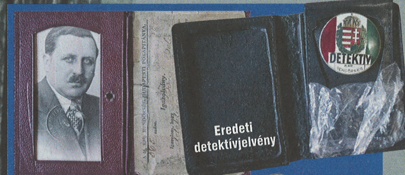
Egy régi detektívigazolvány