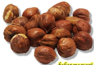
bokor mogyoró (török mogyoró)