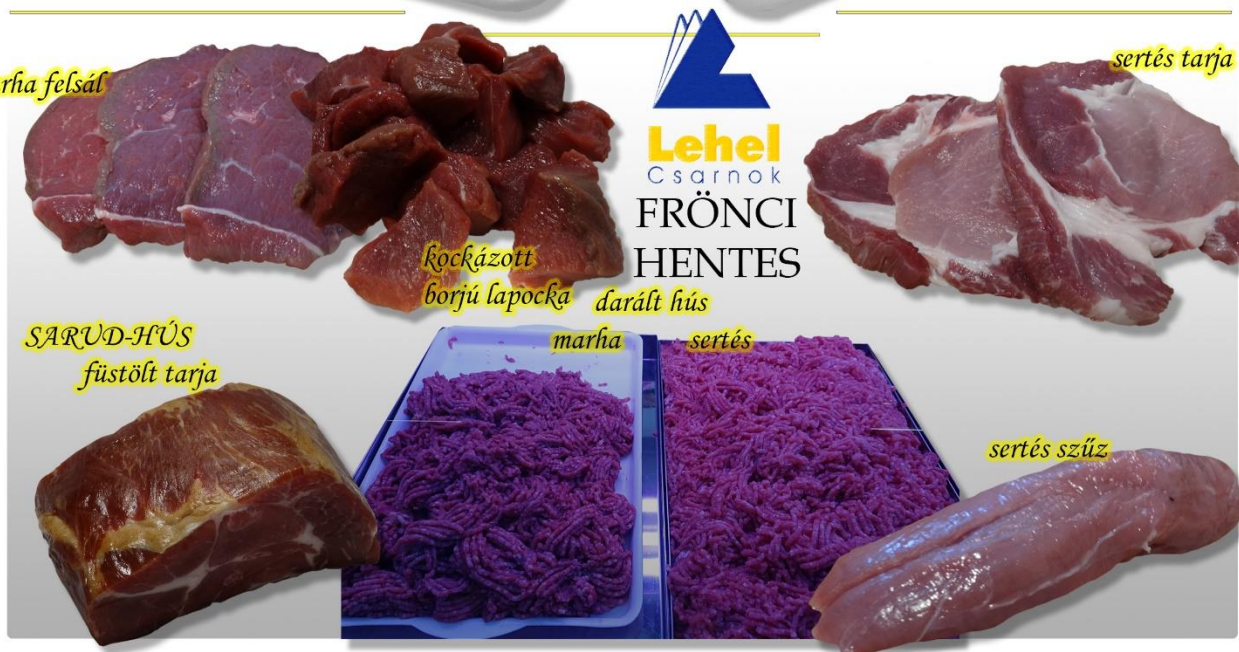
kockázott borjú lapocka darált hús